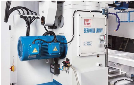
Potente azionamento sul mandrino orizzontale