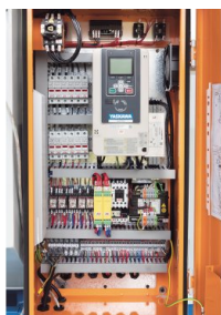
Stufenlos regelbare Spindeldrehzahl mit Yaskawa-Inverter