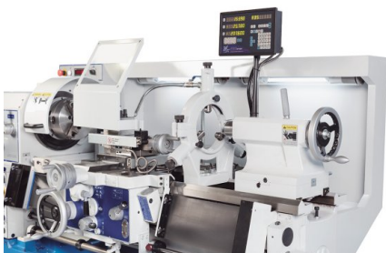
Stabile Lünetten serienmäßig, Abbildung mit optionalem Zubehör