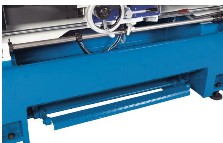
Einstellbare Anschlagnocken schalten den Vorschub automatisch ab