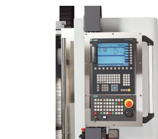
Il controllo SINUMERIK 828D stabilisce nuovi standard in termini di produttività grazie alle prestazioni CNC