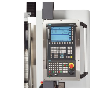
Řízení SINUMERIK 828D udává svým jedinečným CNC výkonem kritéria v produktivitě