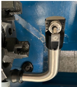
HPRA avec palpeur de mesure RP3