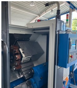
Pied distinct pour un stockage sûr du HPRA