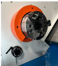
Rychloupínací zařízení v pracovním prostoru