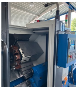
Samostatná stojanová jednotka pro bezpečné skladování HPRA