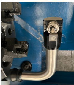
HPRA s měřícím dotykovým přístrojem RP3