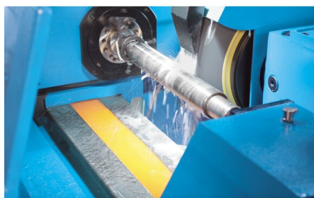
L'avance longitudinale hydraulique est réglable en continu et de façon très précise