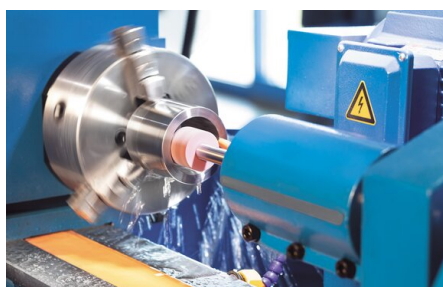
Le diamètre maximal de rectification intérieure est de 100 mm