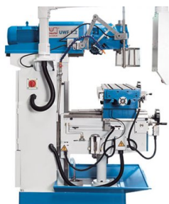
Duży wycięg i długie drogi posuwu