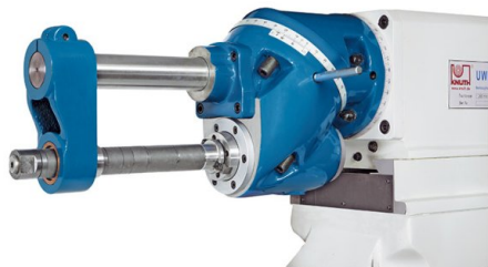
Dispositivo per fresatura orizzontale (incluso nella dotazione standard)

Indicatore di posizione su 3 assi Supporto esterno per fresatura orizzontale Mandrino portafresa con pinze 4, 5, 6, 8, 10, 12, 14, 16 mm Albero portafresa lungo \varnothing 32 mm Circuito di raffreddamento Lampada a LED Manuale d'uso