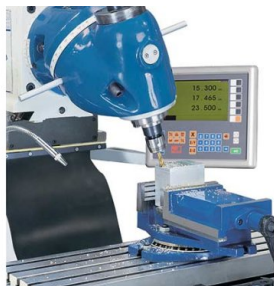
Testa di fresatura orientabile su 2 piani