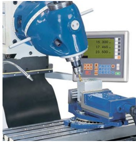
Fräskopf in 2 Ebenen schwenkbar