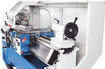
Der Reitstock kann zum Kegeldrehen seitlich justiert werden