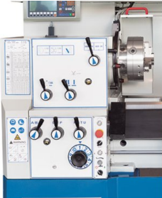
Die umfangreichen Funktionen der Positionsanzeige X.Pos werden hier ergänzt durch die digitale Drehzahlanzeige und leicht programmierbare Zusatzfunktionen