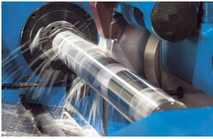
Nachschleifen mit rotierendem Werkstück