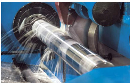
Szlifowanie wykańczające z obracającym się elementem obrabianym