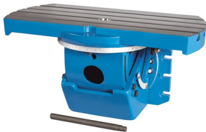
Masă pivotantă universală pentru FPK 4.3 / FPK 6.3 (253721)