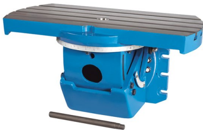
Table pivotante universelle pour FPK 4.3 / FPK 6.3 (253721)