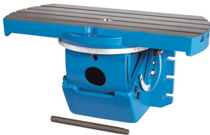
Universalschwenktisch für FPK 4.3 / FPK 6.3 (253721)