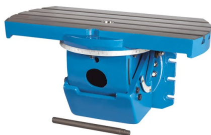
Uniwersalny stół przechylny do FPK 4.3 / FPK 6.3 (253721)