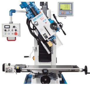
Kopf schwenkbar um \pm 45^\circ