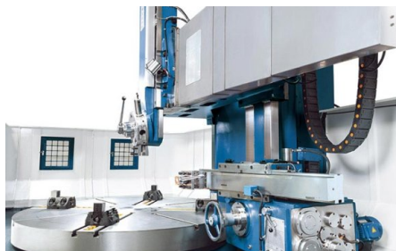
Вертикальный суппорт с 5-разъемной оправкой для инструмента и боковым суппортом с собственной подачей для внутренней и внешней обработки