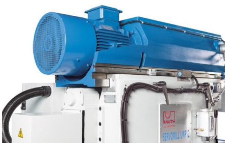
Puissant moteur d'entraînement de la broche principale à pignons de transmission (Servomill® UWF 12)