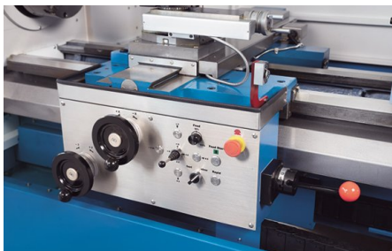
Azionamento mediante volantino elettronico micrometrico - funzioni tattili e posizioni come su una macchina convenzionale