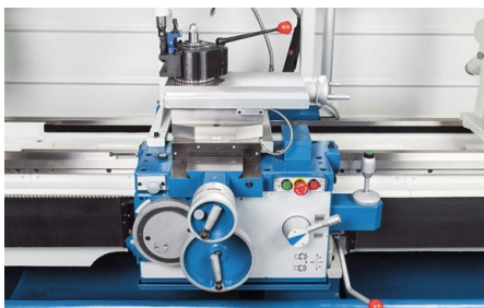
Le support peut être déplacé en avance rapide dans le sens longitudinal et transversal