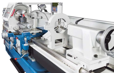
Lunety do precyzyjnej obróbki długich detali