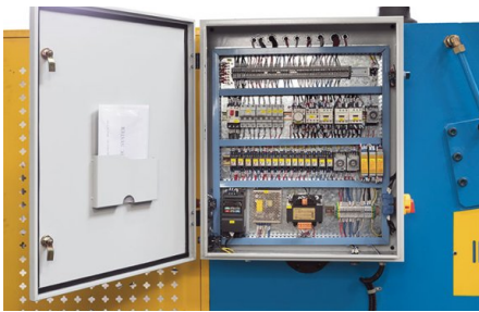
Fiabilité grâce à des composants électroniques haut de gamme