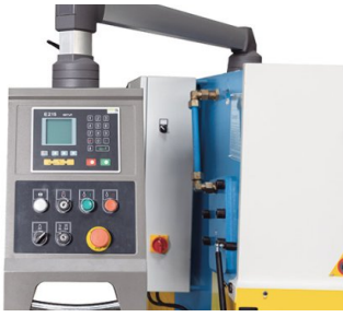
Control NC para un posicionamiento rápido del tope trasero