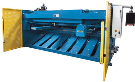
Con el dispositivo de sujeción de placas controlado neumáticamente, incluso las chapas finas pueden posicionarse con gran precisión en el tope trasero