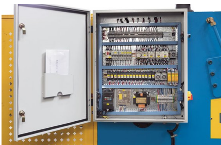
Componentes eléctricos de alta calidad para una máxima fiabilidad