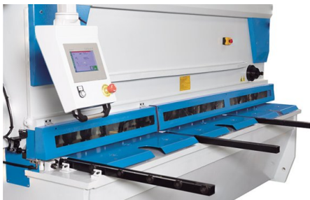
Diseño moderno con una gran mesa de trabajo y un potente control CybTouch 8 G