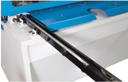
Der Arbeitstisch ist mit Rollenkugeln und einem starren seitlichen Winkelanschlag ausgestattet