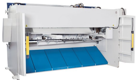
Lichtschranksystem im hinteren Bereich für zusätzlichen Schutz