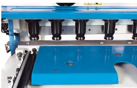
Soportes de gran capacidad para una sujeción segura de los troqueles