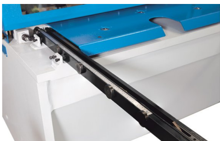
Masa de lucru este prevăzută cu roți și un opritor de unghi lateral fix