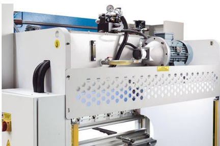
Hydraulická jednotka je umístěna v horní části stroje a poskytuje další prostor pro ohýbání