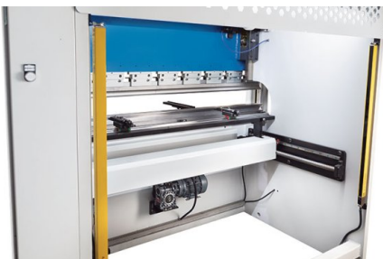
Zadní strana je chráněna světelnou závorou