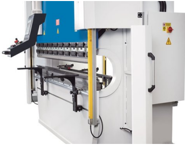
Velké vyložení a úzký stůl poskytují velký volný prostor pro komplexní ohýbání