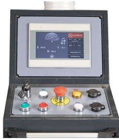
Intuitivní řízení s velkým dotykovým displejem a třemi provozními režimy: ruční/poloautomatický/automatický