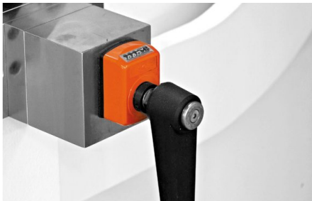
Alle Maschinen sind mit einem manuellen Bombiersystem innerhalb des Tisches ausgestattet. Eine motorisierte Bombierung ist als Option erhältlich.