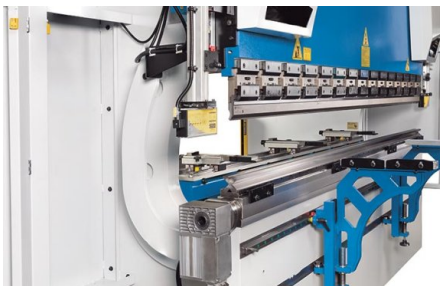
L'option de bombage motorisé de la table permet à l'opérateur de compenser plus rapidement les écarts de la pièce lors du pliage.