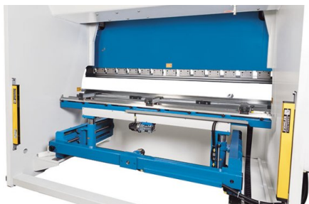
Les machines de cette série peuvent être équipées en option d'un système de butée arrière commandé avec axe R