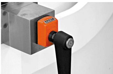
Toutes les machines sont équipées d'un système de bombage intégré dans la table. Une version motorisée du bombage est disponible en option.