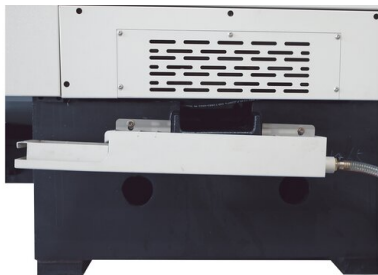
Die integrierte Ölseparierung hält den Kühlschmierstoff sauber, verlängert dessen Nutzungsdauer, verbessert die Werkzeugstandzeiten und reduziert Wartungs- sowie Entsorgungskosten