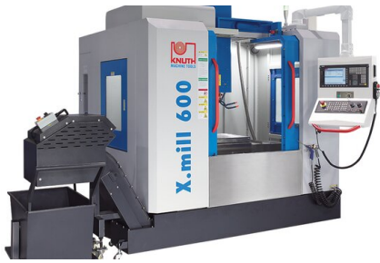
Kettenspäneförderer für die automatische und zuverlässige Abfuhr großer Spanmengen - reduziert Reinigungsaufwand, erhöht die Prozesssicherheit und unterstützt einen unterbrechungsfreien Produktionsablauf