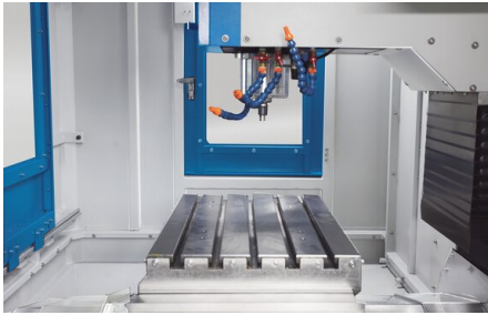
Große Fronttüren und seitliche Wartungszugänge sorgen für beste Erreichbarkeit des Arbeitsraums, vereinfachen das Rüsten und beschleunigen Service- und Reinigungsarbeiten