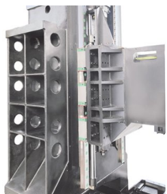
Corpo in ghisa con ampia larghezza di bloccaggio