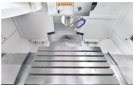
Masa masivă a mașinii cu 5 caneluri