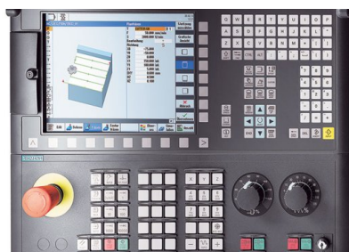
Unitate de comandă Siemens Sinumerik 828D