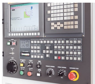
Система ЧПУ Fanuc Oi-MF