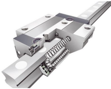
Ghidaje cu role liniare pentru stabilitate maximă