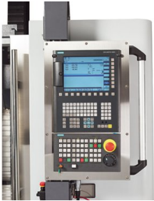
Siemens Sinumerik 828D mit ShopMill