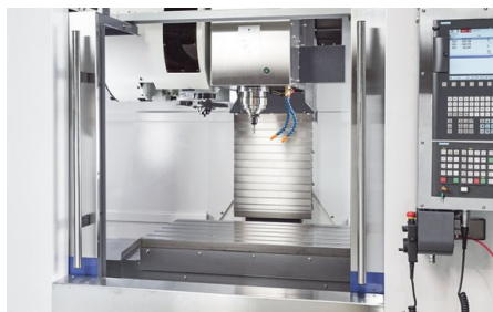
Szeroko otwierające się drzwi przednie