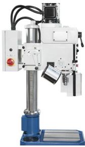
TSB 25: kompakte Ausführung mit Schaltgetriebe