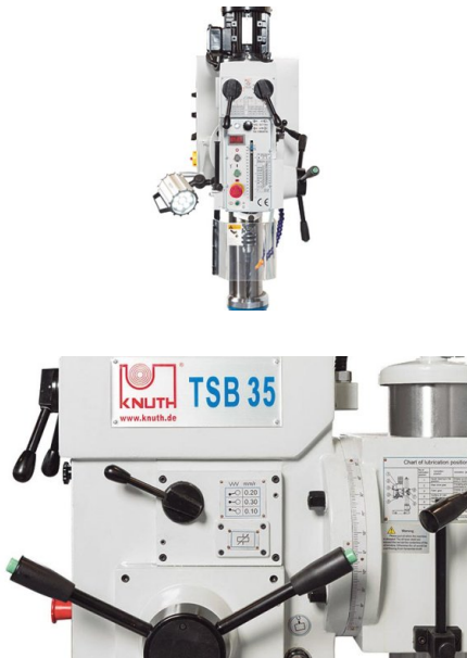
Schwenkbarer Bohrkopf und autom. Vorschub mit 3 Getriebestufen

Untergestell Schutzschild LED-Arbeitsleuchte Bohrfutter Bedienwerkzeug Betriebsanleitung