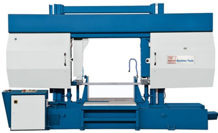
HB1020 L – fácil manipulación de materiales a través de rodillos de entrada / salida