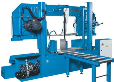
La mesa de rodillos para alimentación es un equipo estándar