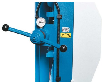
Manometeranzeige für die korrekte Sägeblattspannung - erhöht die Standzeit und senkt die Kosten