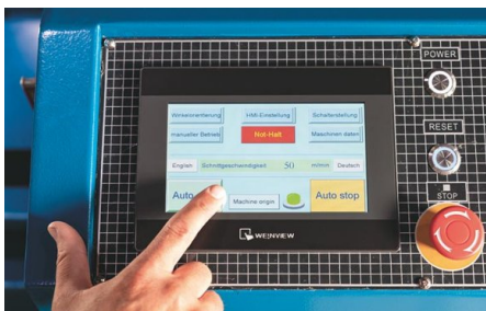
En mode automatique, la longueur d'avance, l'angle de coupe et le nombre de coupes peuvent être programmés dans la configuration correspondante.