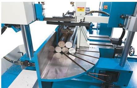
Ambos tornillos de banco están diseñados como tornillos de banco de conjuntos hidráulicos (equipo estándar)