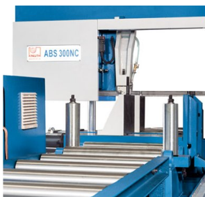
Sériový válečkový dopravník rozšiřuje integrovanou nákladku materiálu