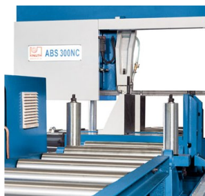
Seryjna bieżnia rolkowa stanowi rozszerzenie dla zintegrowanej podstawy materiałowej