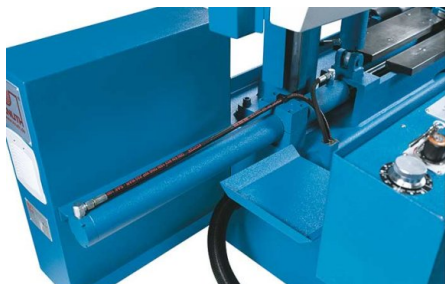
Bloccaggio utensile di tipo idraulico incluso nella dotazione di serie di tutti i modelli