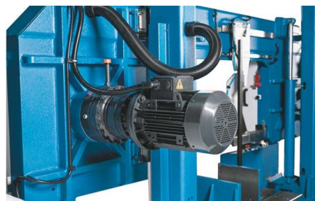
Potente motore d'azionamento a variazione continua