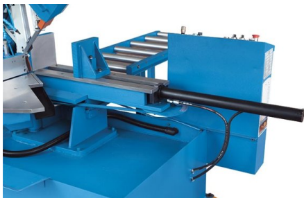
Hydraulische Werkstückklemmung mit großem Spannungsbereich