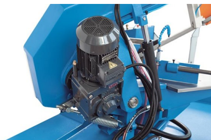
Die kompakte Antriebseinheit garantiert hohes Drehmoment