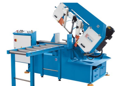
Die stabile Zufuhrrollenbahn ermöglicht leichtes Materialhandling