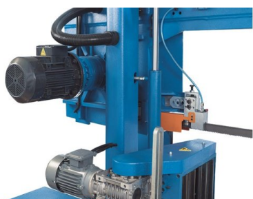
I potenti motori per l'avanzamento della lama e del telaio sono combinati con ingranaggi, sviluppati per rispondere alle tutte le esigenze di lavorazione, a basso livello di rumorosità, ad elevata capacità di carico e compatti